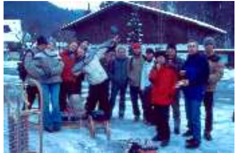
Gruppenbild nach dem RaRo Winterlager