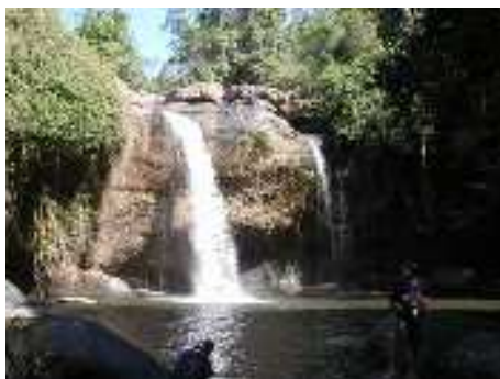
Ein Wasserfall im Urwald