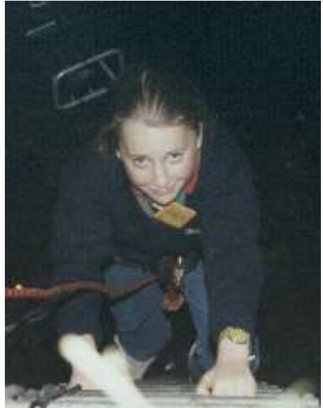
Vici klettert in den Brunnen

die uns „Weihrauch“ und Lebensbänder gaben, um Ungeheuer und Dämonen, die uns unsere Lebensbänder wegnahmen, zu töten. Das Problem war, dass wir einen bestimmten Totenkopf nicht von Anfang an mitgenommen hatten. Während Luki und ich im Versteck der Bösen suchten, hatten die anderen den Kopf irgendwie bekommen. Wir hörten schon den Priester im Turm, in den wir nur mit dem Kopf rein kamen, schreien. Als wir ihn dann den Hexen, die den Eingang versperrten, hinhielten, fielen sie um und wir konnten den Priester retten. Müde und erschöpft haben wir noch Butterkekse mit unseren Namen aus einem Brunnen geholt, bevor wir im Heim der S2-Katze schlafen durften.