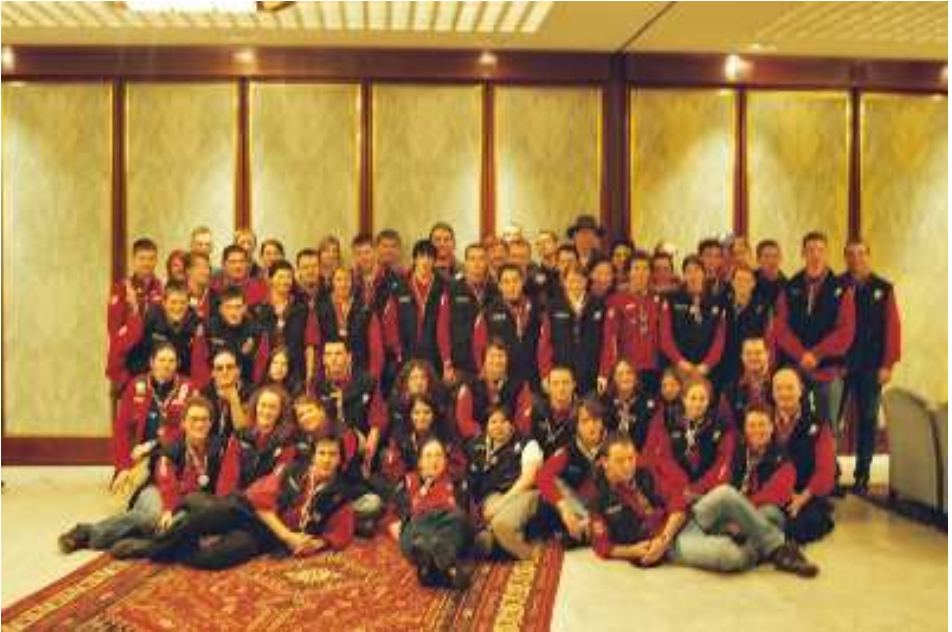
Das österreichische Kontingent vor dem Abflug zum Jamboree in Thailand