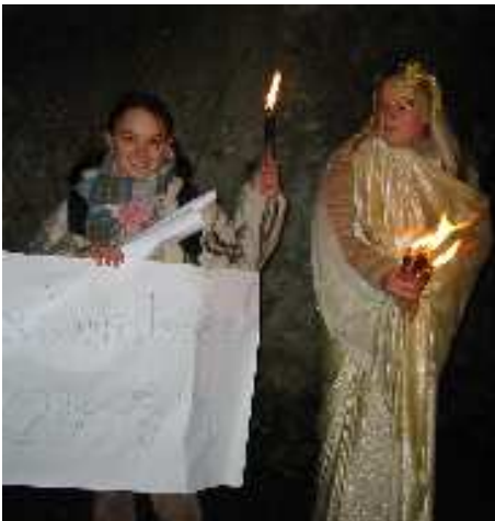
Zusammen mit dem Christkind in Columbien

Da sind wir dem kleinen Mädchen begegnet, das es sich nicht erklären konnte, wie das Christkind zu allen Kindern gleichzeitig kommen kann. Ein Brief an das Christkind hat ihr dann weitergeholfen, und so konnten wir eines der seltensten Ereignisse miterleben: Das Christkind hat sich uns gezeigt und uns auf eine weihnachtliche Reise durch verschiedene Kulturen begleitet. Diese Stationen wurden von den einzelnen Stufen ausgearbeitet.