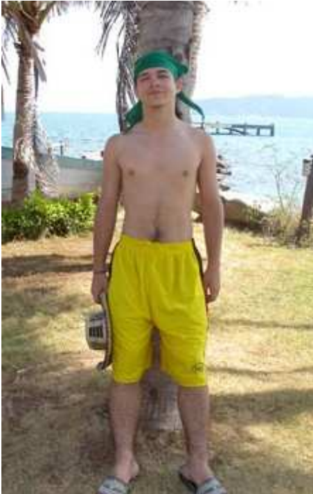
Helmut im Paradies

Auch Österreich war mit einem Kontingent von 60 Pfadfindern vertreten. In Trupps zu je 30 Personen verbrachten wir insgesamt 3 Wochen in Thailand.