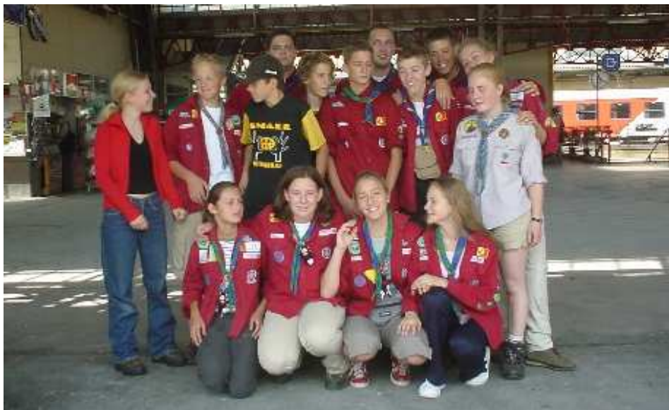
Gruppenfoto vor der Abreise am Bahnhof

wir ja sooo brav waren) gingen wir am Abend super gut essen.