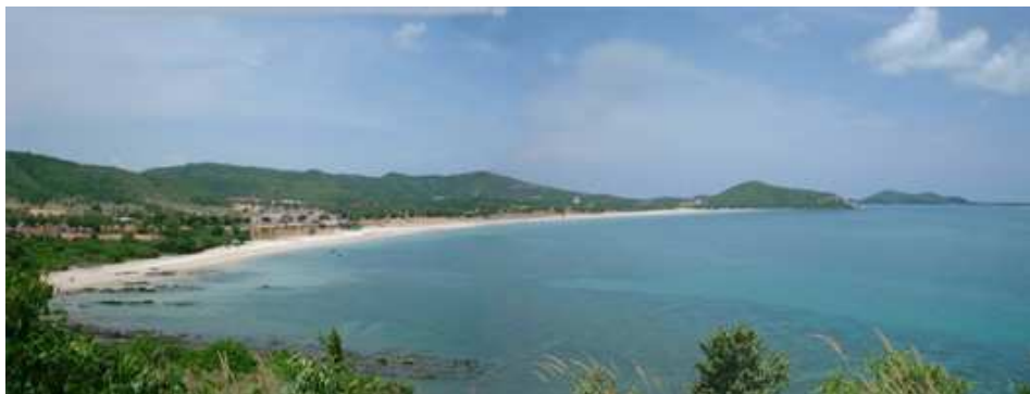
An diesem Urwald-umsäumten Sandstrand fand das Jamboree statt

Feier, Europäer lernten sich zu besinnen, und Asiaten feierten so ausgelassen, dass Silvester nur noch als Kulturschock bezeichnet wurde.