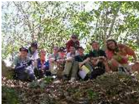
Rast auf einem Hike durch den Dschungel