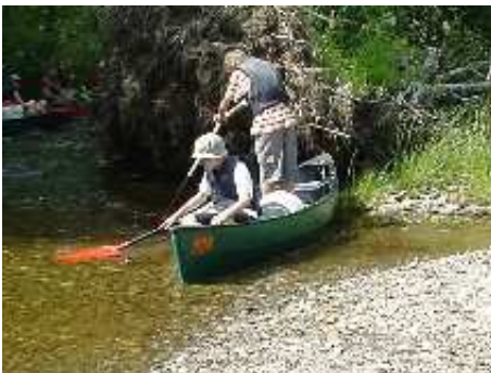
Jetzt nur nicht kentern . . .

Sonntag, 14. Juli Wir haben sooo gut geschlafen, und wir haben sogar so lange schlafen dürfen wie wir wollten! Um 11 standen wir aber zum Frühstück auf, und um 12 hieß es dann auch schon wieder Mittagessen. Tja, und dann wurden wir in 3 Gruppen geteilt, weil wir einen Wettkampf machten. Am Nachmittag sind wir dann ins Freie und haben Knoten gemacht.