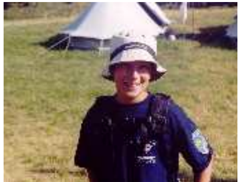
Sonnenschutz ist wichtig