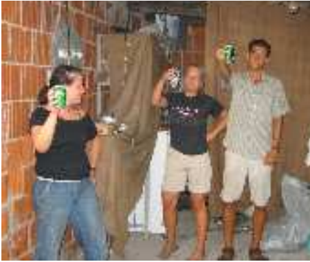
Prost! – Pivo am Campingplatz in Lozovak, in der Nähe des Krka Nationalparks