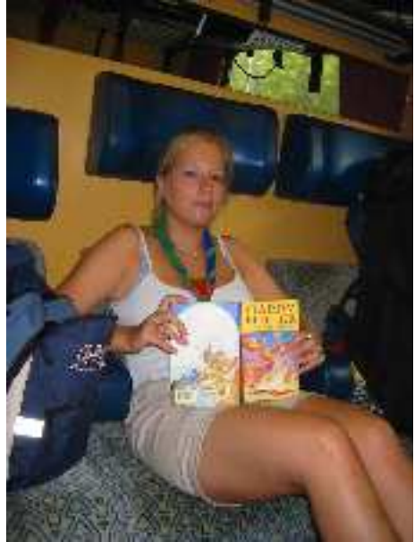
Harry Potter war immer dabei

Dann in Zagreb natürlich zum Maci 4 und weiter im kroatischen Zug. Nach langer, anstrengender Fahrt kamen wir mit einer halben Stunde Verspätung in