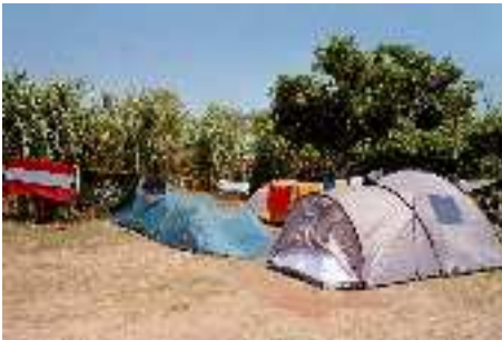
Zeltplatz in Kiparissia

Am Abend packten wir unsere Sachen noch alle fein säuberlich zusammen und gingen das letzte Mal vor der Schifffahrt duschen. Dann sind wir ziemlich bald in die Schlafsäcke! Früh aufstehen war angesagt!