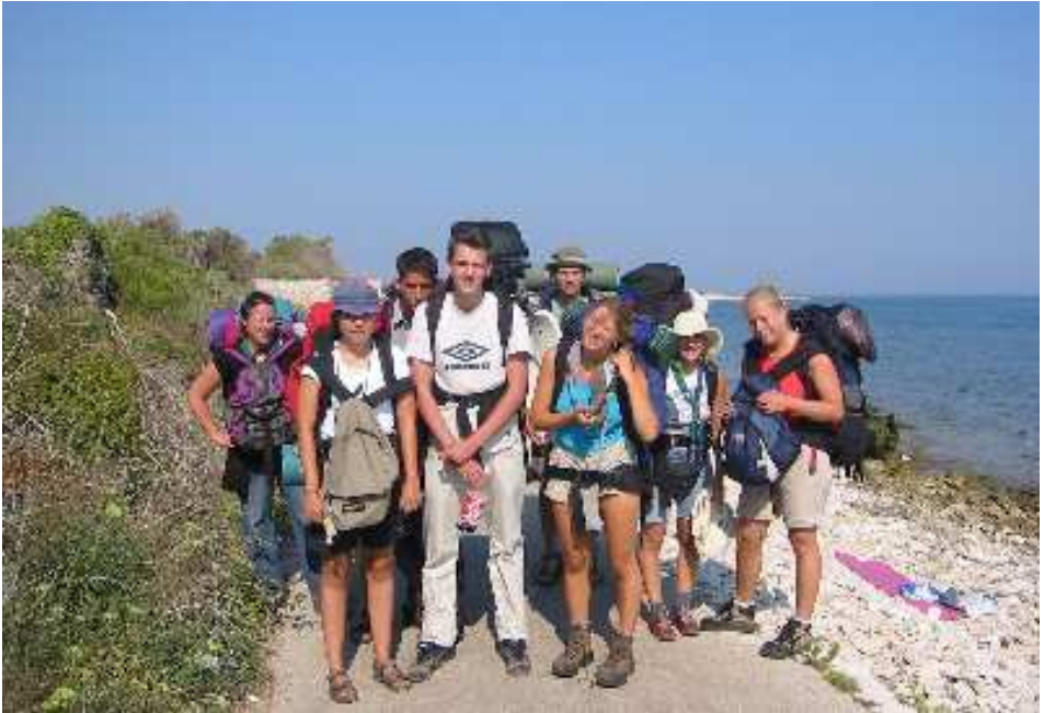
Gruppenfoto bei der Abreise von Supetar