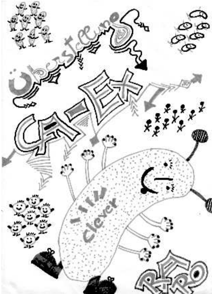
Die Überstellung mit dem Riesen-Snipps (Zeichnung von Lucia Vesely).