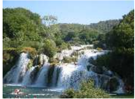
Die berühmten Fälle der Krka (Skradinski buk) – komplett mit Badenden und Baywatcher

tung Krka Nationalpark. Nach ein paar Komplikationen fanden wir auch dort einen gemütlichen, kleinen Campingplatz (wobei klein untertrieben ist).