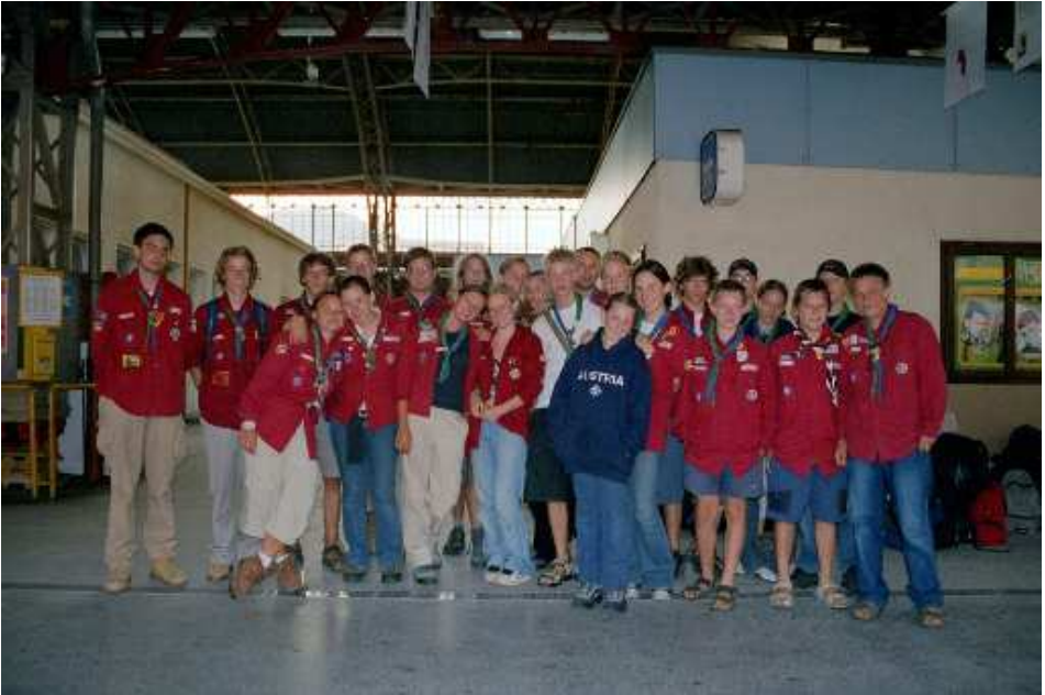
Gruppenfoto am Bahnhof

Als Belohnung durften wir zum ersten Mal ins Meer und danach auch gleich wieder in den Schatten ... Gefahr!!! SONNENSTICH!!! Gefahr!!!