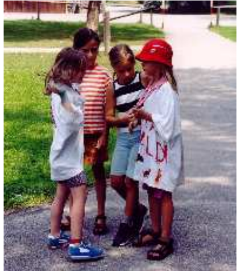
Wichtel am Sommerlager

Meine Tochter ist nun seit Ostern dieses Jahres bei den Wichteln und es gefällt ihr unheimlich gut. Unbedingt wollte sie auch auf Sommerlager mitfahren, und ich hatte so meine Bedenken wegen der aufwendigen Extrakochei und der extra Eiweißverabreichung. Vici und Dodo räumten meine Bedenken aber sofort aus dem Weg und wollten abwechselnd das Kochen für Ines