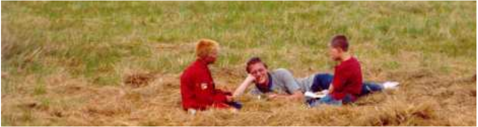
Ablegen im Heu

9. Juli Wir standen normal auf und aßen unser Frühstück. Nach dem Frühstück machten wir uns daran, die verschiedenen Spezis zu absolvieren. In unserer Patroulle machten alle das Spezialabzeichen Beschleichen. Leider wurden wir unterbrochen, weil es zu schütten begann.