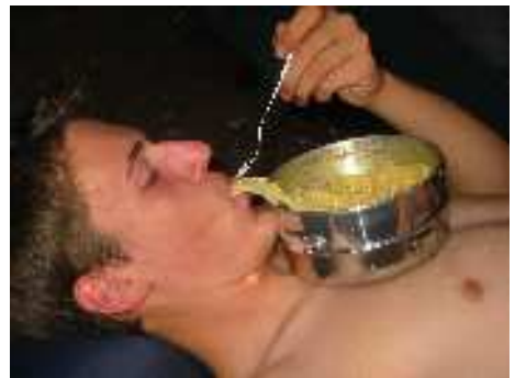
Verzehr von Spaghetti – nicht ganz nach Knigge