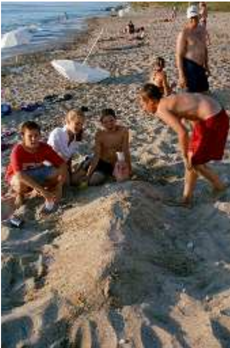
CaEx beim Sandspielen

eine Burg kann man es ja gar nicht mehr nennen, weil es waren nur noch kleine Teile davon da. Aber der Weg dort hin war sehr anstrengend und da war es jedem eigentlich eh egal wo wir waren – wenigstens sitzen! Beim Zurückgehen