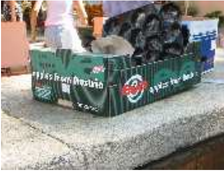
„Apples from Austria“ am Markt in Split