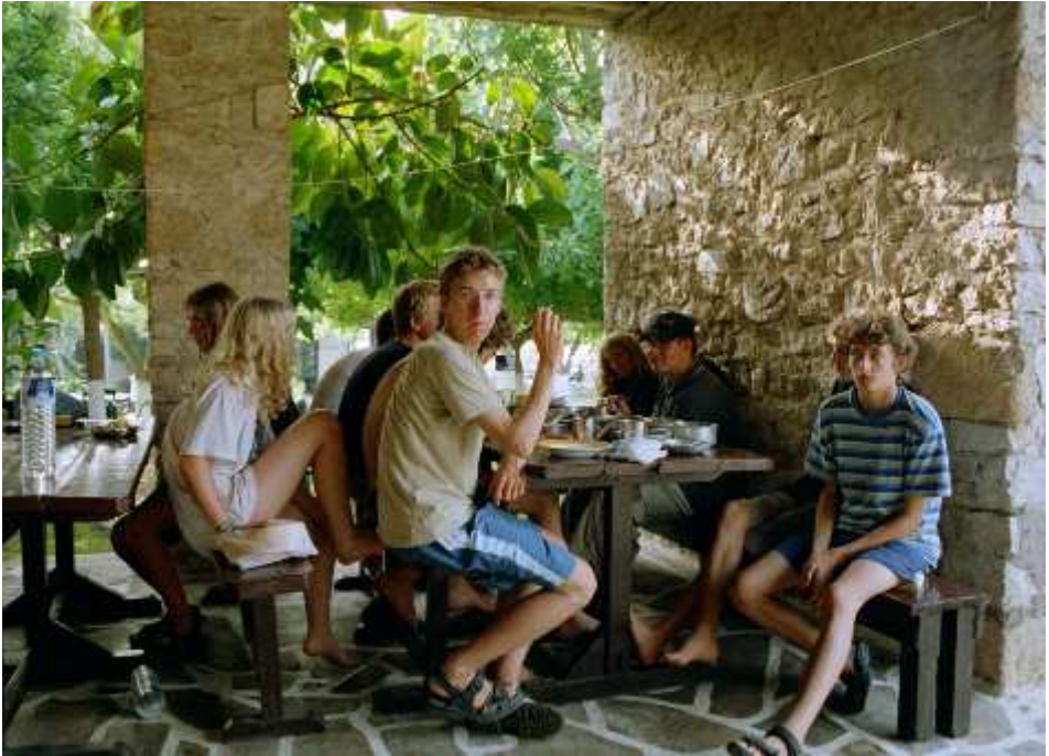
Essen am Campingplatz in Kiparissia

Stadt, die, wie wir bald merkten, wohl nur vom Tourismus lebt: ca. 20 gleiche Geschäfte!