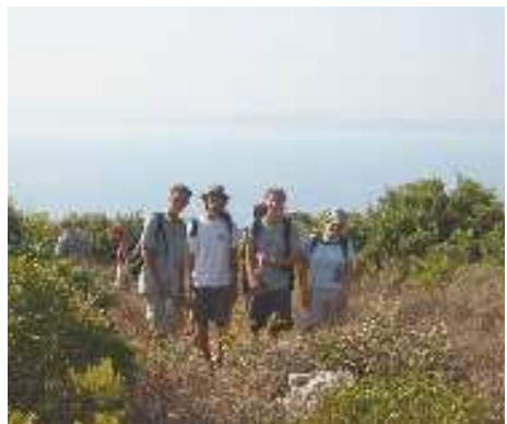
Wanderung zur Höhle auf Hvar

Als wir auch in Jelsa alle Cafés ausprobiert hatten, ging’s weiter in Rich-