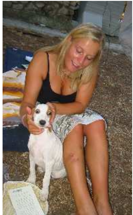
Lästiger Hund am Campingplatz in Trogir – roch eigenartig nach Deo Spray ...