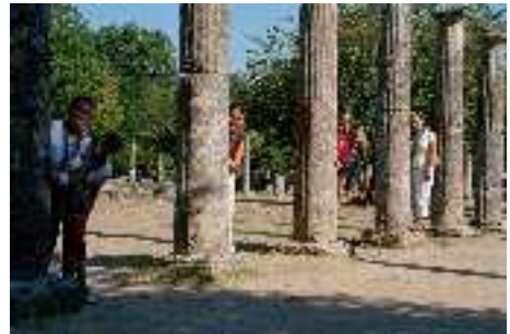
Versteckspiel hinter antiken Säulen in Olympia

Am Abend gingen wir dann noch ziemlich oft duschen ( Anm.: warum? ) und bald in den Schlafsack!