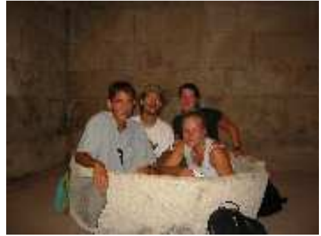
In der Badewanne des Diokletians in Split