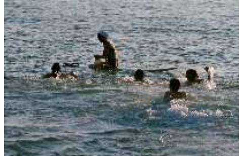
Strandolympiade in Kiparissia

Wie neugeborenen faulenzten wir dann den ganzen Vormittag und schauten unseren Mitfahrenden (hihi) beim Schwimmen zu; wir hatten nämlich einen super coolen Pool (und Whirlpool) an Deck ... nur war niemand von uns Pfadis dort schwimmen ( Anm.: Warum nicht? ).