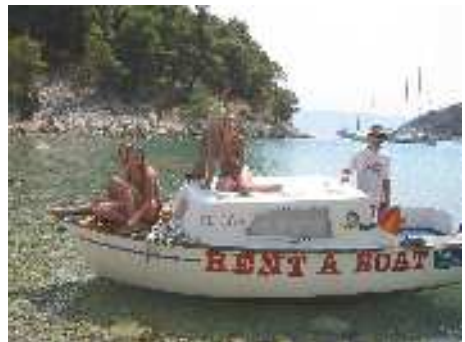
„Rent a Boat“