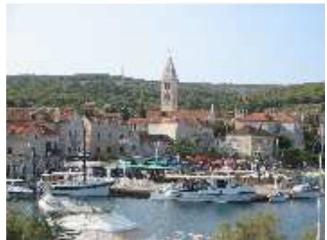
Die Metropole Supetar auf Brač

Wir gingen einkaufen, zum Strand und besorgten uns noch Bier und Wein. Nach einer Weile waren wir schon echt lustig und hatten sehr interessante Gespräche. Dann lernten wir durch Schrei-