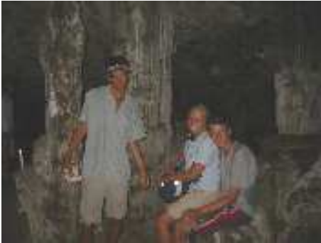
In der „Grapčeva špilja“ auf Hvar

Brač. Dort verbrachten wir die nächsten 4 Tage in einer kleinen touristischen Stadt namens Jelsa.