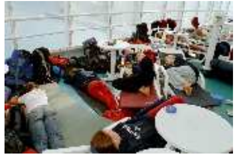
Schlafen auf der Fähre