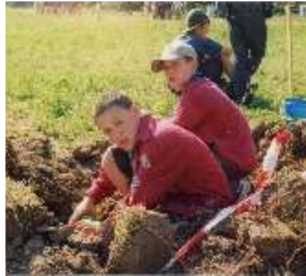
Die GuSp halfen dem verrückten Professor bei seinen Ausgrabungen und wurden dabei auch bald fündig

Lagerolympiade, bei der wir den 2. und 3. Platz belegten. Am Abend hatten wir ein schönes Lagerfeuer. Dann gingen wir schlafen.