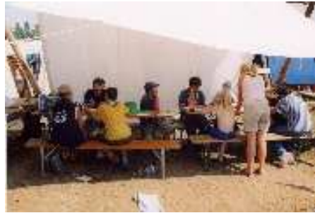
Ablegen im Schatten der selbstgebauten Kochstelle

Die letzten beiden Lagertage fehlen leider in beiden Logbüchern, daher gibt