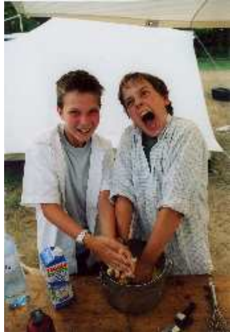
Das Zubereiten von faschierten Laibchen ist eine patzige Angelegenheit