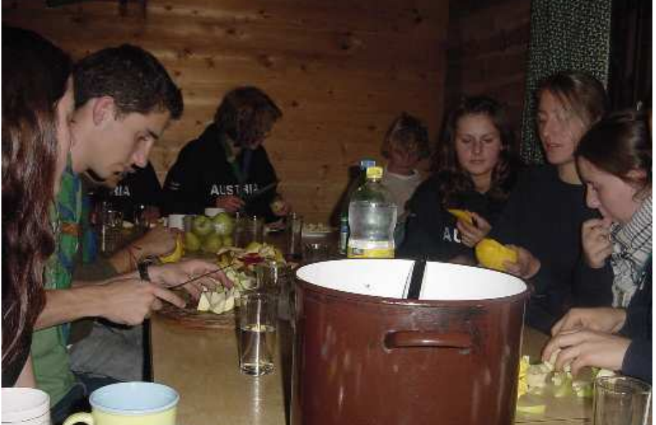
Vorbereitung für das Schoko-Fondue