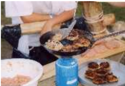
Die Burger brutzeln in der Pfanne

Dienstag, 3. 8.: Wir stellten unsere Kochstelle fertig und hatten dann die meiste Zeit des Tages Freizeit. Wir