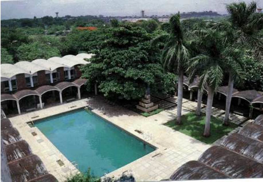
Das WAGGGS Weltpfadfinderzentrum Sangam

Österreich nur schwer vorstellen kann – z.B. würde bei uns kein Kind mit 10 Jahren nicht mehr in die Schule gehen, um den Haushalt zu machen und auf die anderen 7 Geschwister aufzupassen, weil die Eltern den ganzen Tag auf einer Baustelle arbeiten. WAGGGS unterstützt viele soziale Projekte, bei denen man sich persönlich beteiligen kann (z.B. beim Bau von Schulen helfen, Kindern ein Basiswissen an erster Hilfe und Hygiene beibringen . . .), wobei der Schwerpunkt auf der Verbesserung der Situation für Kinder liegt, die so die Möglichkeit bekommen sollen, zu eigenverantwortlichen, gesunden Menschen mit Lebensperspektiven heranzuwachsen – ganz im Sinne der Pfadfinder.