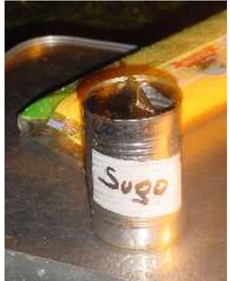
Regen, Nudeln, Sugo – letzteres mangels passendem Werkzeug mit einer Axt geöffnet

Stellen Sie sich vor ... ein riesiger Abhang, steil bis zum geht nicht mehr, rutschig, mit Steinen gepflas-