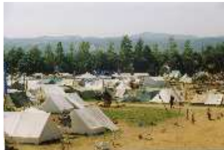
Der Lagerplatz des GuSp Unterlagers

Wir sind angekommen und haben uns alles erklären lassen. Dann gingen wir zum Markt. Danach machten wir verschiedene Stationen. Ein Professor machte ein Experiment und machte alle Bewohner des Farbenlan-