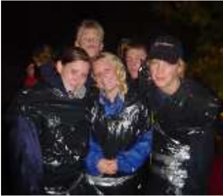
Die hochmotivierte Truppe der angehenden RaRo – fertig verpackt in schicke Müllsäcke

Die Expedition RaRo startete am 24. September 2004 an einem Tag wie man ihn sich nicht schöner und perfekter vorstellen kann: Es regnete in Strömen bei herrlichen 8° Außentemperatur.